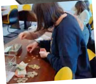
Vente de Muguet au profit de l'association « Petits cadeaux pour gros Bobos »

NOUS CONTACTER : mairie@ploubezre.fr mairie : 02-96-47-15-51 Instagram : Cmj_de_ploubezre