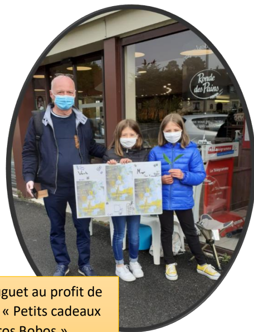
Vente de Muguet au profit de l'association « Petits cadeaux pour gros Bobos »

Sensibilisation auprès des élèves de CM2 au port du gilet orange dans les transports scolaires