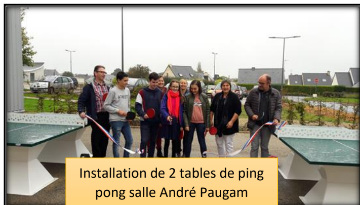
Installation de 2 tables de ping pong salle André Paugam